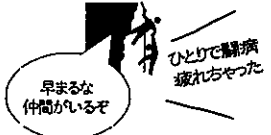
早まるな仲間がいるぞ ひとりで難病 疲れちゃった