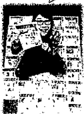
「解散したバンドも復活してるよ」 などのご期待にも感謝(笑)