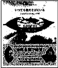
「いつでも君のそば にいる」リト@葉っぱ 切り絵 講談社

◇何とも優しく、物語や表情が あって素敵なお話。切りの切りの世 界です。 神奈川県・女性