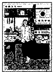
「しあわせは食べて 寝て待つ」1巻 水風トリ 秋田書店