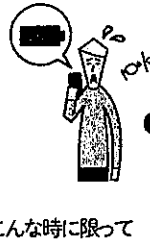
こんな時に限って

10月にとった「災害時の携帯充電器に関するアンケート」(90名が回答)によると「停電時でも使える充電器を用意してある」と答えた人は、約半数の56%(右下図)。また