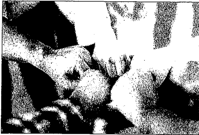
(相手を間違わなければ) 話すとおちよっと気持ち軽くなる

2020年春以降、話せる場所や精神的支えが遠のきました。新たな方法で病気や障害を持つ人の孤独を解消すべく、奮闘する人たちがいます。本号は、そういった活動の1つで自宅のベッド