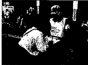
署名活動の様子