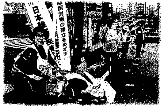
署名活動の様子

※5：難病連とは「難病団体連絡協議会」のこと。JPAは、もともとあった3つの患者団体がひとつにまとまったもので（難病対策や社会保障制度のことなど）国との唯一の交渉窓口。